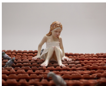
ורד אהרונוביץ שעון הקוקיה | זמן דיוקן | אוצרת: איה לוריא