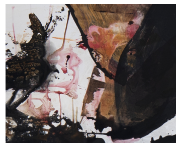
ציבי גבע דרך איפה אני מגיע | זמן דיוקן | אוצרת: איה לוריא